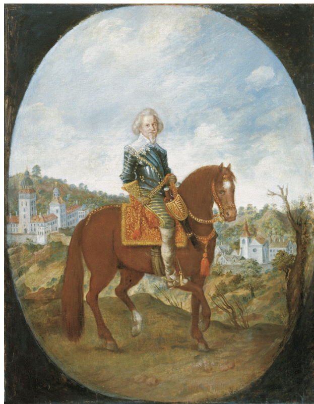
Portrét knížete Gundakera—v pozadí zámek v Moravském Krumlově.

Dva roky po její smrti se v roce 1618 oženil s o 20 let mladší Alžbětou Lukrécie vévodkyní Těšínskou (1599 - 1653), dcerou posledního těšínského vévody Adama Václava a Alžběty Kurlandské. Tento sňatek prosazoval jeho bratr Karel I. vévoda opavský a krnovský, který tím chtěl posílit pozice rodu ve Slezsku. Současně to pro Liechtensteiny byl prestižní sňatek s významným vévodským rodem.