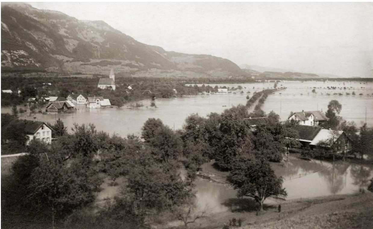
Dobová fotografie ukazuje široké území knížectví, které bylo zaplaveno vodou z řeky Rýna. Od dvacátých let povodním zabraňují hráze podél toku řeky.

Lichtenštejnská vláda se obrátila s žádostí o pomoc na své sousedy, Švýcarsko a Rakousko. Oba státy vyslaly na pomoc při záchranných pracích vojáky a vojenské ženisty. Počet mrtvých se každou hodinou zvyšoval, ale nebylo možné zjistit žádné podrobnosti o ztrátách na životech, protože všechny telegrafní a telefonní linky byly strhány záplavou. Škody na majetku prý dosáhly mnoha milionů dolarů.