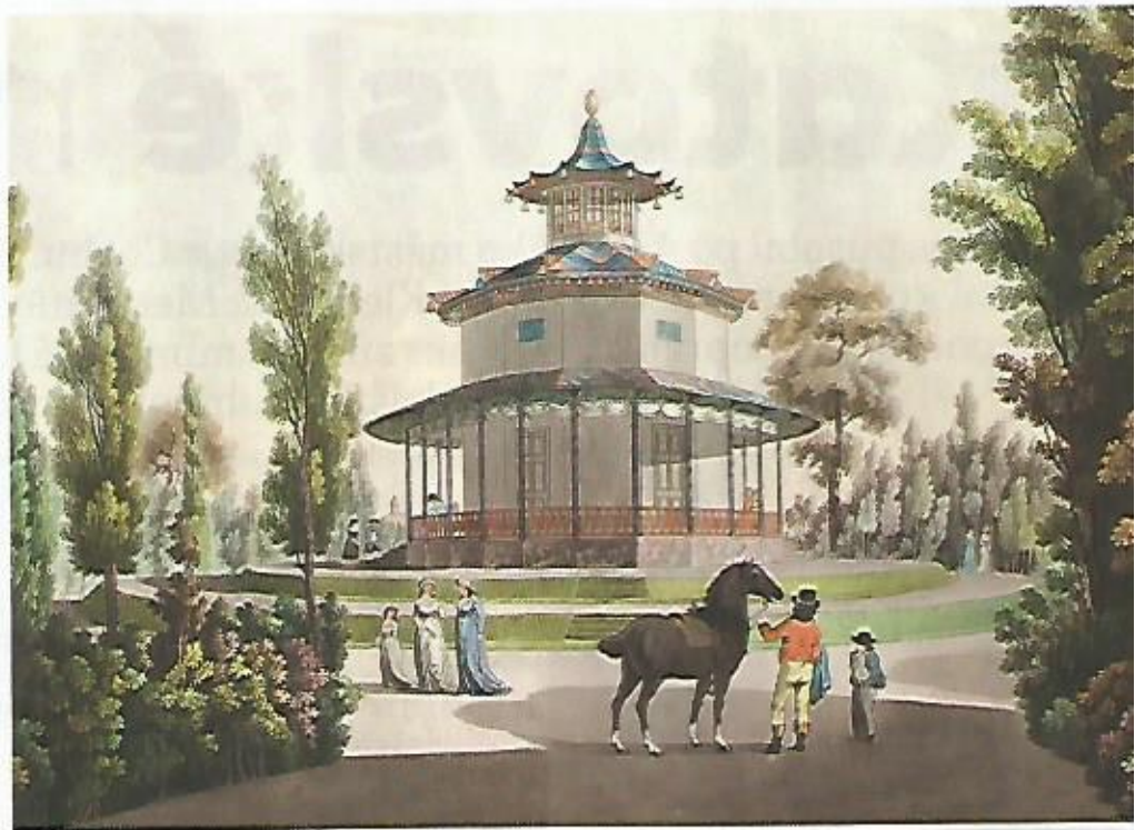
☞ Čínský pavilon v původním lednickém parku, grafika Johanna Andrease Zieglera podle Laurenze Janschiho, kolem roku 18

Jak je zřejmé, v lednickém parku se prolínaly motivy čerpající z nábožensko-duchovního, kulturního a filozofického odkazu Orientu, z historie „temného“ až „tajemného“ středověku a z mystiky gotických katedrál, z kulturního odkazu antického Řecka a Říma, starověkého Egypta a též z Dálého východu reprezentujícího Konfuciovo učení.