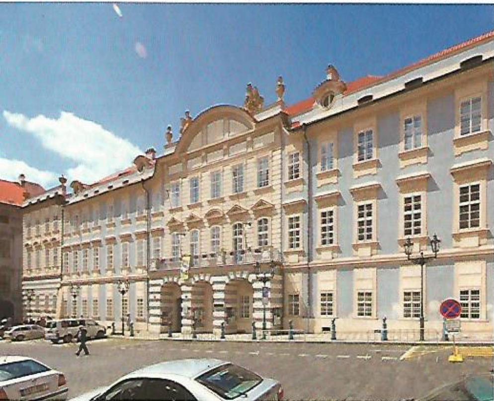
▲ LICHTENŠTEJNSKÝ PALÁC na Malostranském náměstí v Praze by v žalobách Nadace knížete z Lichtenštejna neměl figurovat, i když nese rodové jméno. Je totiž majetkem Hudební a taneční fakulty Akademie múzických umění v Praze, nikoli státu.