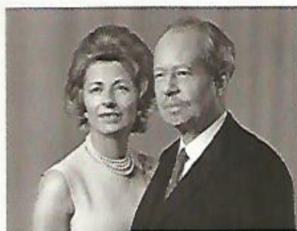
▲ Kníže František Josef II. Lichtenštejnský s manželkou Georginou

Konfiskace rozsáhlých lichtenštejnských majetků probíhaly v bývalém Československu ve dvou vlnách. Jeden z nejmocnějších šlechtických rodů nejprve zasáhla pozemková reforma po založení republiky v roce 1918. Ta ho připravila o značnou část hospodářské půdy. Za tento zábor bylo Lichtenštejnům přiznáno odškodné zhruba ve čtvrtinové výši tehdejší tržní ceny. Ke druhé konfiskaci, tentokrát už veškerého zbyvajícího majetku Lichtenštejnu u nás, došlo v roce 1946 na základě takzvaných Benešových dekretů. Členové aristokratického rodu, který v té době vládl vlastním nezávislému státu, byli označeni za Němce a majetek jim byl odebrán bez nároku na ná-