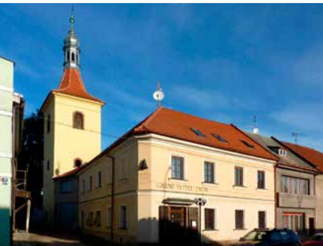
Garni hotel Zvon byl původně špitálem Smiřických pro nemocné a staré sloužící