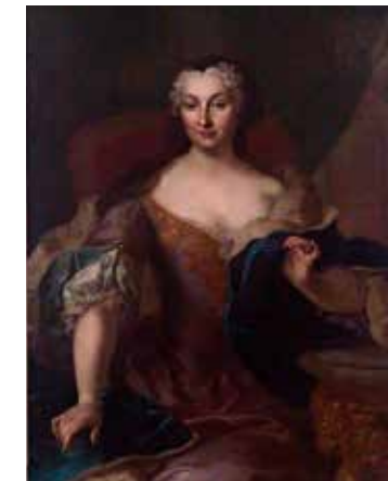
Vévodkyně Marie Terezie Savojská na prostém portrétu s vdovským závojem

měště Frankfurtu šperky a luxusní zboží v hodnotě 300 000 zlatých a stejnou částku ve zlatě (ty později zabavil císař). Hovořilo se o něm jako o příštím českém králi, ostatně doprovázeli ho jezdci oblečení do zemských červeno-bílých barev, nikoli do černo-bílých barev rodu Smiřických. Mladý Albrecht Jan ale zemřel na tuberkulózu již dne 18. listopadu 1618. Koncem ledna 1619 pak do Černého Kostelce dorazil pohřební průvod a Albrechtova rakev byla uložena v kryptě