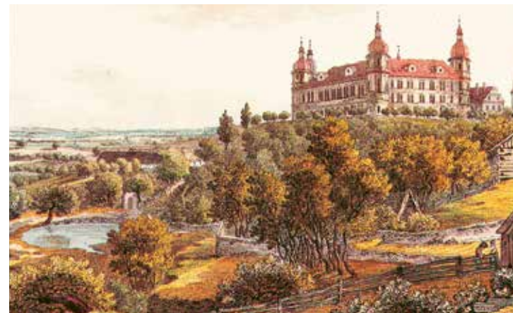
Dobový pohled na černokostelecký zámek ukazuje jeho nádheru