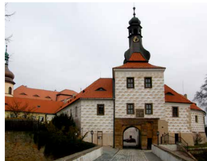
Renesanční barbakán u první brány je cennou stavební památkou, před ním se nacházejí zbytky hlubokého obranného příkopu