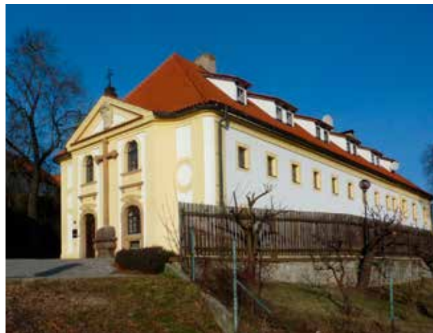
Velkému špitálu v roce 1987 hrozila demolice, ale dobrovolníci tuto cennou památku zachránili