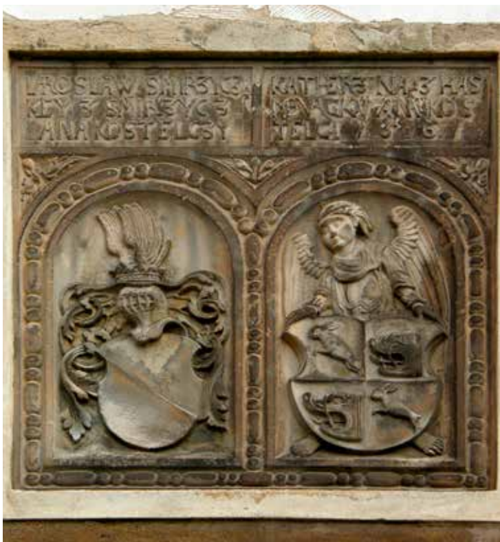
Alianční erb Jaroslava I. Smiřického ze Smiřic a jeho manželky Kateřiny Zajícové z Hazmburka nalezneme nad první bránou

Smiřičtí byli na přelomu 16. a 17. století nejbohatším českým panským rodem. Kromě černokosteleckého panství jim patřila panství Uhřetěves, Koloděje, Říčany, Stříbrná Skalice, Hrubá Skála, Jičín, Náchod, Ratibořice a další. Velmi dobře hospodařili a jako první dali přednost vlastnímu podnikání před robotou. Jako jediní z velkých rodů si nemuseli půjčovat peníze, naopak je sami za úrok půjčovali. Posledním Smiřickým byl Albrecht Jan (1594-1618), jeden z vůdců stavovského povstání. Právě v paláci Smiřických na Malé Straně se v úterý 22. května 1618 konala porada radikálních vůdců opozice, na níž byl dohodnut ostrý postup proti císaři Matyášovi. Hned následující den došlo ke třetí pražské defenestraci a vypuknutí povstání. Zajímavostí je, že zatímco většina „rebelů“ se zajímala hlavně o to, jak zbohatnout, Albrecht Jan byl jediný, který stavům poskytl peníze a na vlastní náklady platil pluk pěšáků. Předem uložil ve svobodném říšském