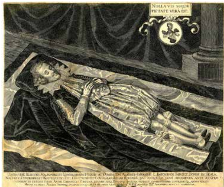
Albrecht Jan Smiřický („nekorunovaný český král“) na smutečním katafalku na konci roku 1618