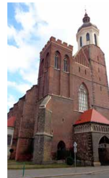
Z režných cihel vystavěná konkatedrála Nanebevzetí Panny Marie

slezské, která zde úřadovala v letech 1878-1928. Původně zde byl klášter klarisek a šlechtický palác, dnes zde sídlí Slezská univerzita. Z mnoha dalších církevních památek města musíme upozornit ještě alespoň na dvě. Dominikánský klášter s nádherným kostelem sv. Václava založil roku 1291 opavský kníže Mikuláš I. Po zrušení v roce 1786 kostel téměř zanikl, ale díky městu Opava byl po roce 1990 zachráněn. Jeho rekonstruované prostory v současnosti slouží jako kulturní centrum s pozoruhodným geniem loci. A konečně, mezi dominanty města se řadí také kostel sv. Hedviky, patronky Slezska, který byl