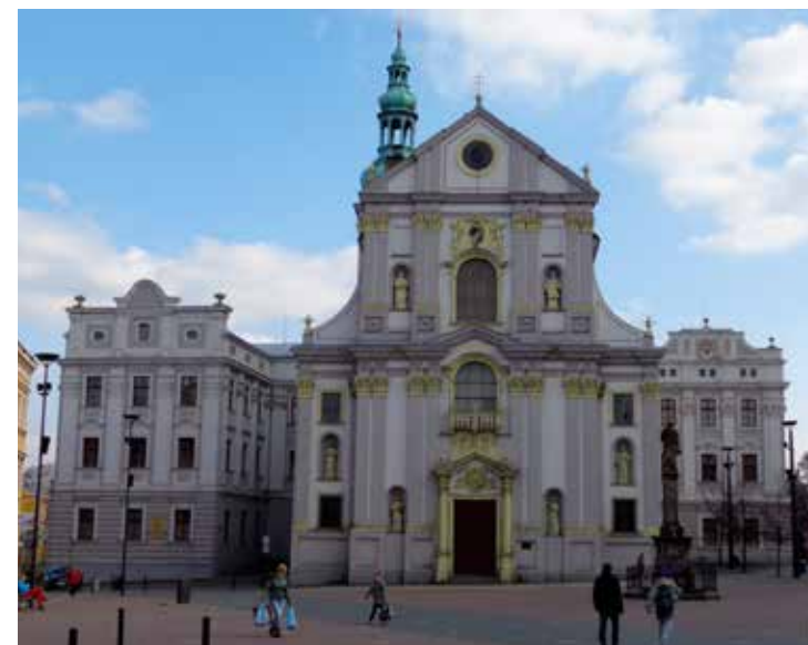
Někdejší jezuitská kolej s kostelem sv. Vojtěcha, v současnosti sídlo Zemského archivu

Opavský hrad byl vystavěn kolem roku 1400 knížetem Přemkem, ale již po roce 1456 ztratil sídelní funkci. V letech 1607-1634 byl středověký objekt přestavěn na renesanční zámek. V roce 1890 ale stavbu získalo město a o dva roky nato ji zbořilo. Zachoval se jen dům správce, tzv. Müllerův dům. Na uvolněném místě pak v letech 1893-1895 vzniklo novorenesanční Slezské zemské muzeum. K založení tohoto muzea ovšem došlo již v roce 1815, takže je nejstarší veřejnou a dnes také třetí největší sbírkotvornou institucí v českých zemích. Jeho vznik a umělecké sbírky velmi štědře podpořil kníže Jan II. z Liechtensteina (1840-1927). Vratme se však ještě na chvíli zpět do starší historie. Důležitým mezníkem v dějinách Opavy se stal rok 1625, kdy do města přišli jezuité, jejichž gymnázium a škola podpořily rozvoj zdejší vzdělanosti. Po zrušení řádu v roce 1773 se jezuitská kolej stala sídlem opavského zemského sněmu. Dnes tu sídlí Zemský archiv, jehož fondy jsou třetími nejrozsáhlejšími u nás. Komplexu zdejších budov vévodí majestátní chrám sv. Vojtěcha. Cenná je rovněž konkatedrála Nanebevzetí Panny Marie, vybudovaná z režných cihel v tzv. slezském stylu. Její románské základy položil Řád německých rytířů, který měl v Opavě svou komendu. Uvnitř