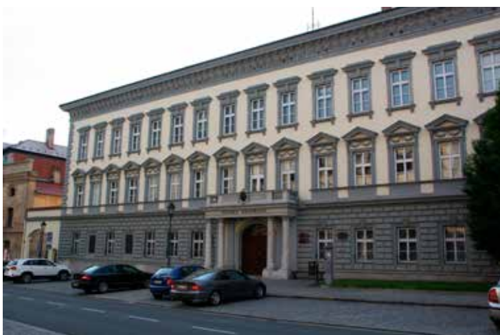
Bývalé sídlo Zemské vlády slezské, dnes slouží Slezské univerzitě

o Opavsko se starali opravdu vzorně. Po porážce Rakouska Pruskem v roce 1742 Opava získala funkci hlavního města zbylé rakouské části Slezska. Zemský sněm zde sídlil až do roku 1918,