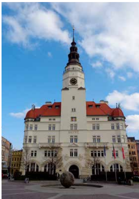
Ikonická budova radnice s věží Hláškou