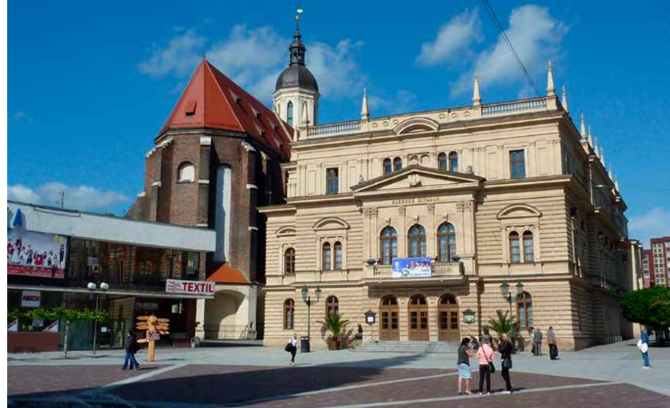
Slezské divadlo a vedle stojící konkatedrála Nanebevzetí Panny Marie patří mezi nejpůsobivější stavby historického centra Opavy