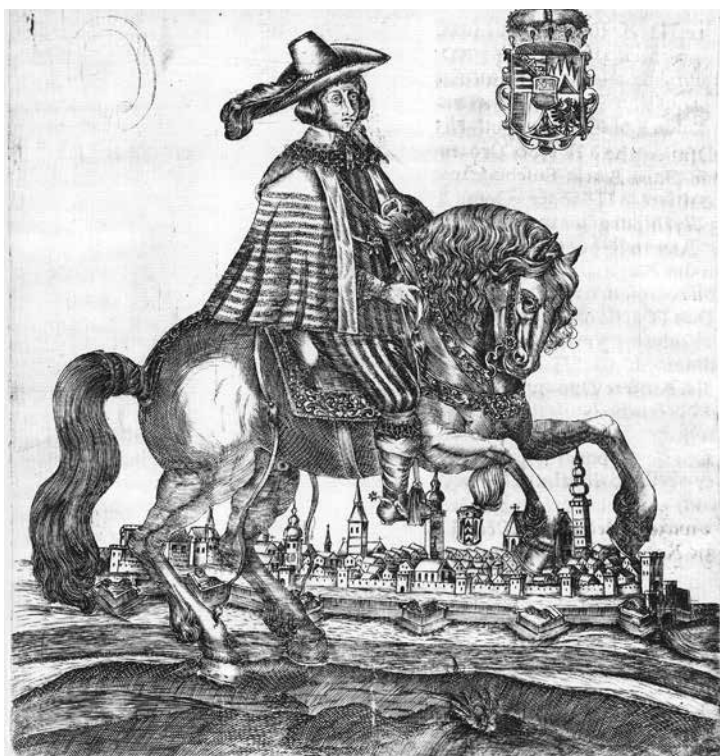
Příjezd knížete Karla Eusebia z Liechtensteina na hold stavů v Opavě (letopočet 1632)