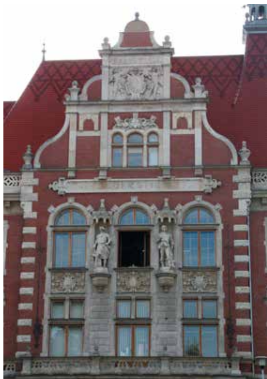
Zdobná fasáda městské spořitelny

projevilo i v řadě výjimečných veřejných staveb. Na prvním místě uvedme novorenesanční radnici s věží Hláška o výšce 60 m. Z jejího ochozu si můžeme prohlédnout krásy města i jeho okolí, pokud vystoupáme 183 schodů (část cesty lze absolvovat také výtahem). Z Hlášky spatříte jako na dlani původně novorenesanční budovu Slezského divadla (s interiéry ve stylu krále Ludvíka XV.), později upravenou v duchu tzv. reálného socialismu, ale také třeba obchodní dům Breda z let 1927-1928. Ten byl jedním z prvních v českých zemích a nyní se připravuje jeho rekonstrukce. Nedaleko náměstí stojí skvostná budova spořitelny, vystavěná ve stylu německé renesance roku 1902. V monumentální novobarokní budově bývalé filiálky