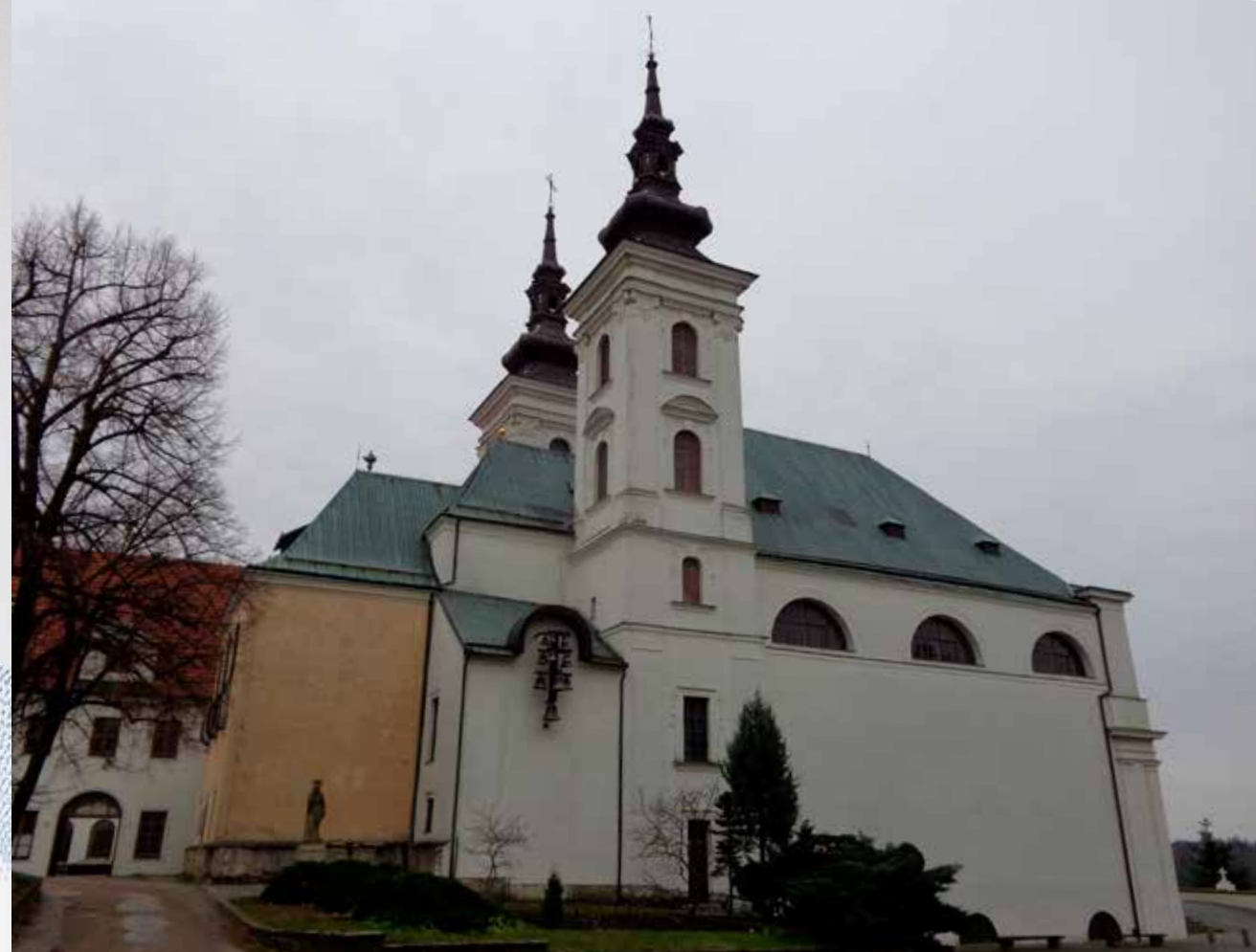
Poutní chrám Narození Panny Marie byl vybudován v letech 1617-1633 v barokním slohu