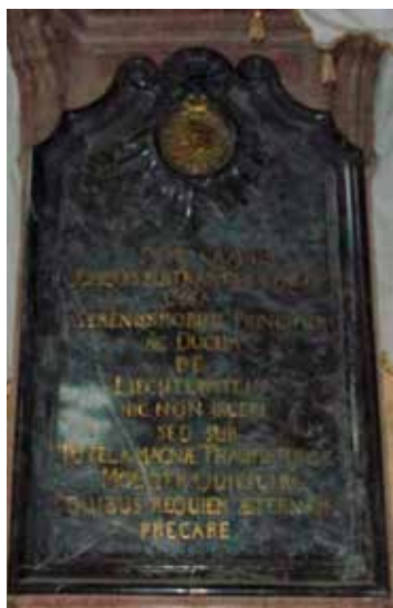
Uvnitř poutního chrámu nalezneme nádherný epitaf Liechtensteinů z roku 1777