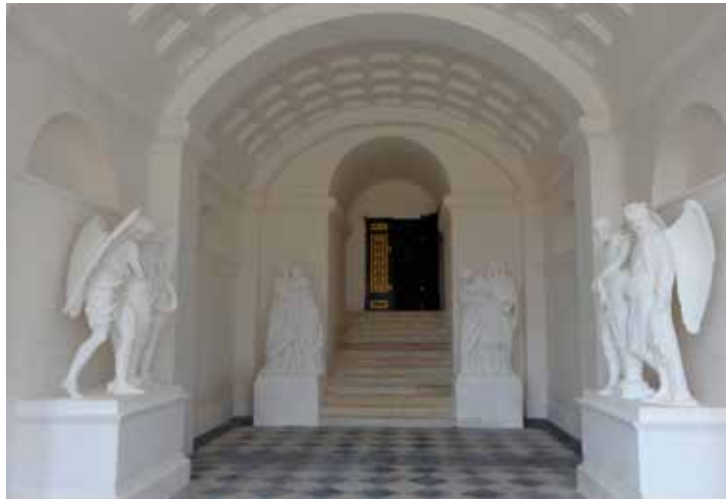
Předsíň hrobky se čtveřicí sousoší strážců uren a žen, které se s pláčem loučí se zesnulými a vítají zemřelé v posmrtném životě