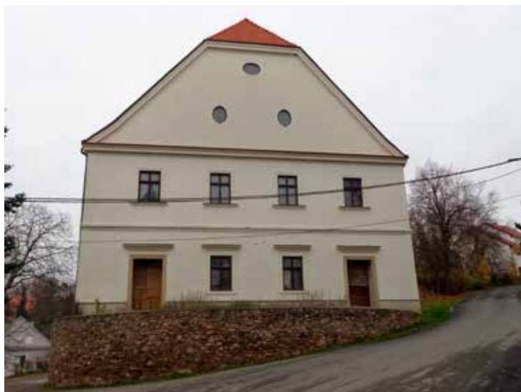
Poblíž náměstí se nachází rozlehlá budova bývalého chudobince z roku 1703, později upravená na hostinec