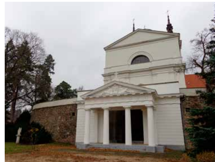
Monumentální klasicistní průčelí vchodu do hrobky Liechtensteinů imituje antický chrám

Klášteří a poutní areál v současnosti tvoří jednoduchý chrám Narození Panny Marie s dvojicí