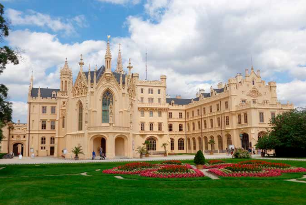
O dnešní podobu lednického zámku se postaral kníže Alois II. z Liechtensteinu.