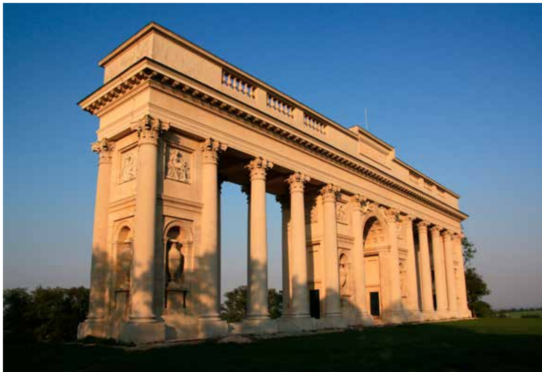
Vznosná Kolonáda nad Valticemi sloužila v letech 1948-1999 jako vojenská pozorovatelna. Dnes ji obdivují turisté.