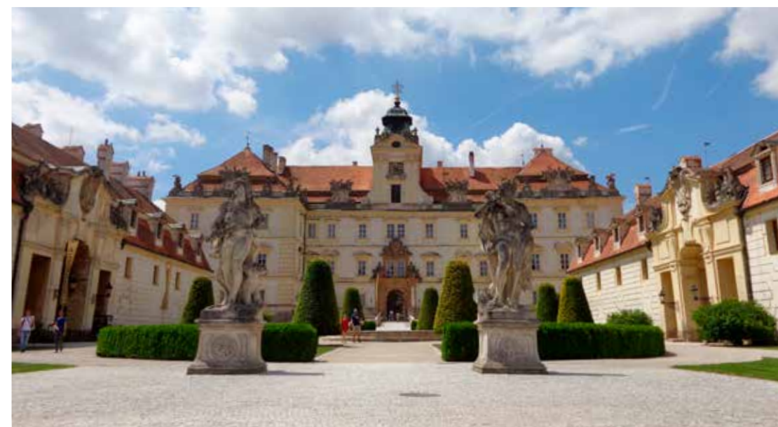
Čestný dvůr valtického zámku, jehož postranní budovy sloužily úředníkům knížete Antona Floriána z Liechtensteinu, nejvyššího hofmistra císaře.

Přední architekt rakouského klasicismu Josef Kornhäusel (1782-1860) vybudoval pro Liechtensteiny zámek Lány, Pohansko, Rybniční zámeček, Apollonův chrám a v roce 1815 zahájil klasicistní přestavbu zámku Lednice. Jeho dílem je i chrám Tří Grácií u Prostředního rybníka. V tzv. palladiovském stylu vybudoval v letech 1826-1827 Hraniční