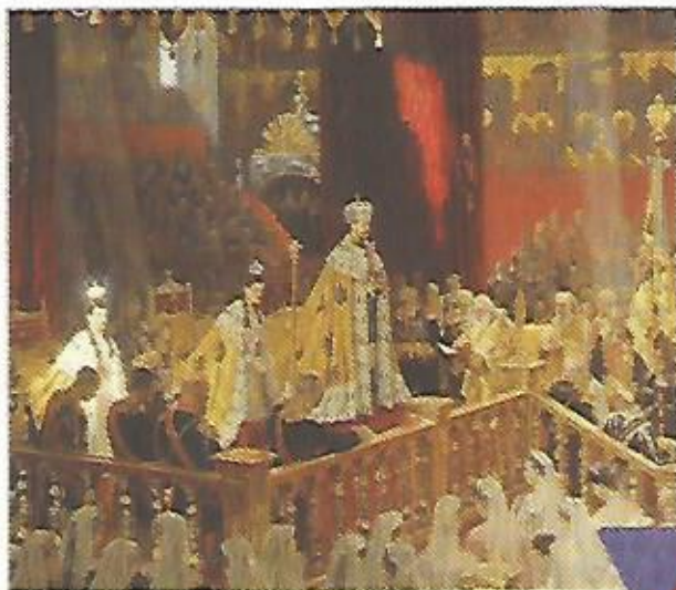
♠ Korunovace cara Mikuláše II. roku 1896 na plátně Lauritse Tuxena