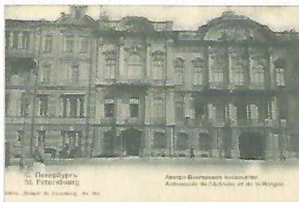
Palác rakousko-uherského velvyslanectví v St. Petěrburgu