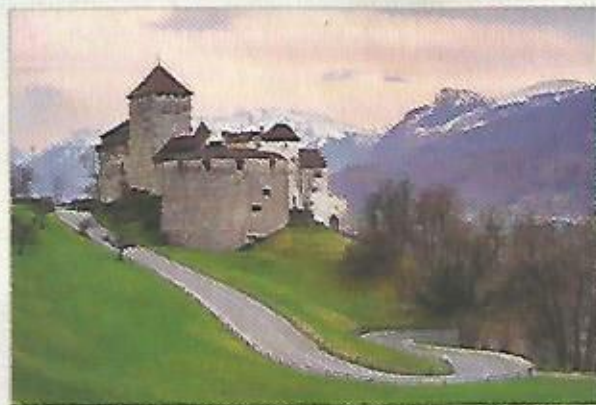
♠ Současná podoba hradu Vaduz, oficiálního sídla lichtenštejnské knížecí rodiny

19. století a Jan II. zvaný Dobrý začal podporovat hospodářský rozvoj země včetně výstavby protipovodňových hrází. Péče rodu přivedla Lichtenštejnsko po roce 1945 k hospodářskému závraku. Ovšem Lichtenštejnům zde paradoxně patří jen 140 hektarů vinic a další zemědělské půdy, hrad Vaduz a několik nemovitostí.