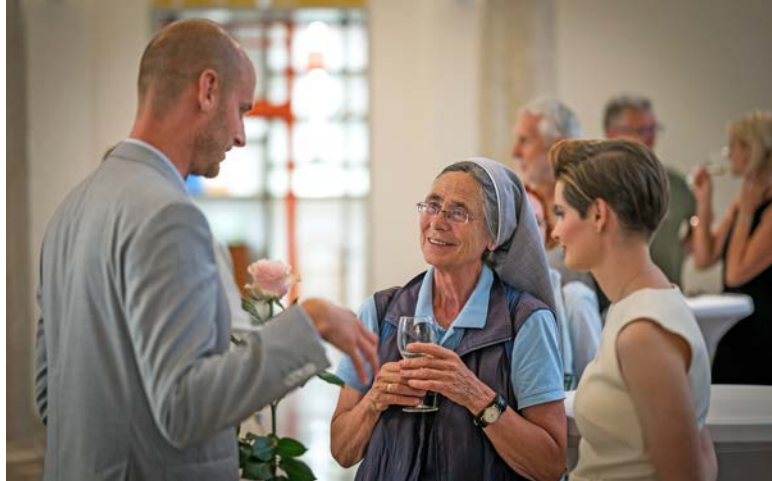
Mezi přednáškami měli posluchači možnost společně probrat své postřehy a dojmy