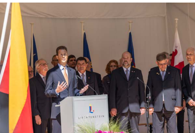
Projev JJ dědičného prince Aloise z Lichtenštejna

Po smrti Františka Josefa II. v roce 1989 bylo rozhodnuto, že se Národní den bude slavit i nadále 15. srpna, i když narozeniny současné hlavy státu, tedy knížete Hanse Adama II., připadají na 14. února. Důvody pro toto rozhodnutí jsou především praktické – slavit Národní den v létě je určitě lepší než slavit ho v zimě, kdy slavnosti mohou být ovlivněny počasím. Podobně s oslavami královských narozenin naložili také v Lucembursku, Nizozemí nebo Velké Británii. V roce 1990 byl Národní den právně uznán jako lichtenštejnský státní svátek a od té doby se v tento den každoročně konají státní ceremonie na louce u hradu Vaduzu. 15. srpna odpoledne se tak hlavní město vždy zaplní různě starými lidmi, kteří si užívají tradiční oslavy a pouť. Národní den je následně velkolepě zakončen půlhodinovým ohňostrojem přímo vedle knížecího hradu. ■