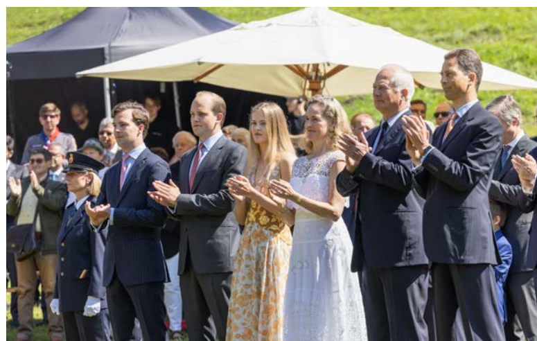
Členové knížecí rodiny i ostatní účastníci oslav Národního dne si vyslechli projevy důležitých osobností