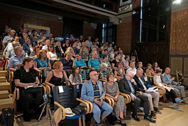
Zvědaví posluchači zcela zaplnili nádherný sál Uměleckoprůmyslového muzea Moravské galerie v Brně

na osobnost knížete Jana II. z Lichtenštejna, jehož sbírky a dary do dnešních dní obohacují různá moravská muzea. Přítomní se tak například dozvěděli i to, že kníže, zvaný Dobrotivý, na svých panstvích podporoval průmysl, zakládal nemocnice a sirotčince a zasloužil se o vznik první přírodní rezervace na Moravě, dnes známé jako Národní park Šerák-Keprník.