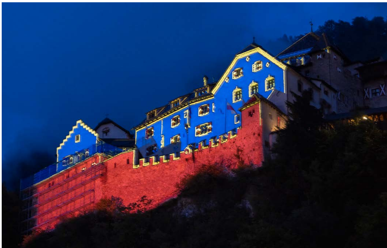
Hrad Vaduz byl u příležitosti oslav nasvícen do lichtenštejských národních barev

Poprvé byl 15. srpen označen za národní svátek lichtenštejskou vládou v roce 1940. Toto datum má pro Lichtenštejnce dvojí význam. Jednak byl 15. srpen už v té době státním svátkem připomínajícím Nanebevzetí Panny Marie, jednak oslavuje narozeniny