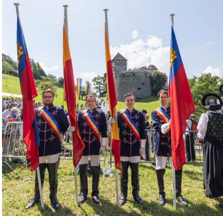
Oslavy Národního dne provázelo slunné počasí