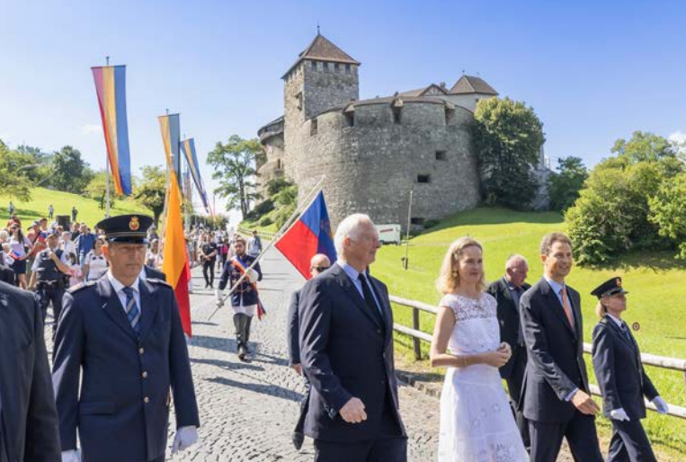
Vládnoucí kníže JJ Hans Adam II. s dalšími členy rodiny schází od hradu Vaduzu

knížete Františka Josefa II., který se narodil 16. srpna 1906, a který byl otcem současného vládnoucího knížete Hanse Adama II. z Lichtenštejna. Svátek je zvláštní tím, že byl zaveden v době války. Jen pár dní před ustanovením tohoto svátku jedním z nejmenších států světa řekl ve svém projevu Adolf Hitler, že „malé státy nemají žádné právo na existenci,“ takže zavedení tohoto národního dne může být chápáno jako akt patriotismu, stejně jako akt vzdoru.