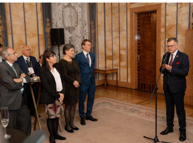
Petr Svoboda přednáší projev na zahajovací recepci v Rezidenci primátora hlavního města Prahy