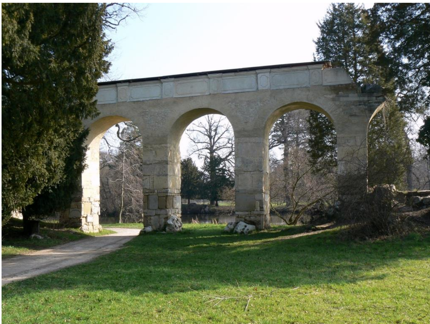
Pohled na opravený římský akvadukt v lednickém zámeckém parku

http://www.ceskatelevize.cz/zpravodajstvi-brno/zpravy/238317-v-lednici-po-sto-letech-zprovoznili-stary-akvadukt/