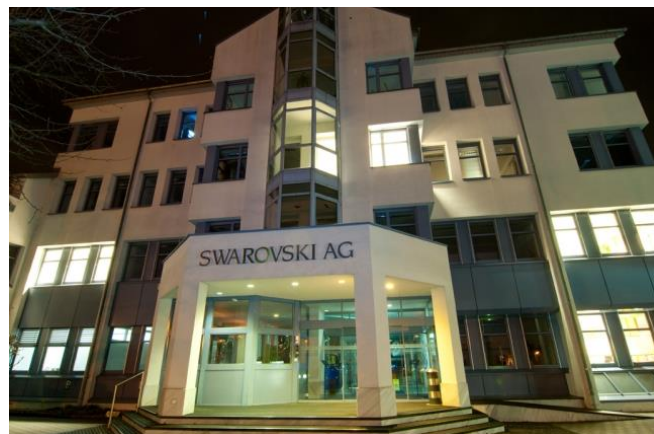
Sídlo firmy Swarovski AG v lichtenštejském Triesenu

Wattens, poblíž Innsbrucku, kde si pronajal tovární prostory. V roce 1895 Swarovski založil vlastní podnik na výrobu šperků a bižuterie, která se velmi brzo prosadila na trhu a začala bižuterii vyvážet do Německa, USA a Velké Británie.