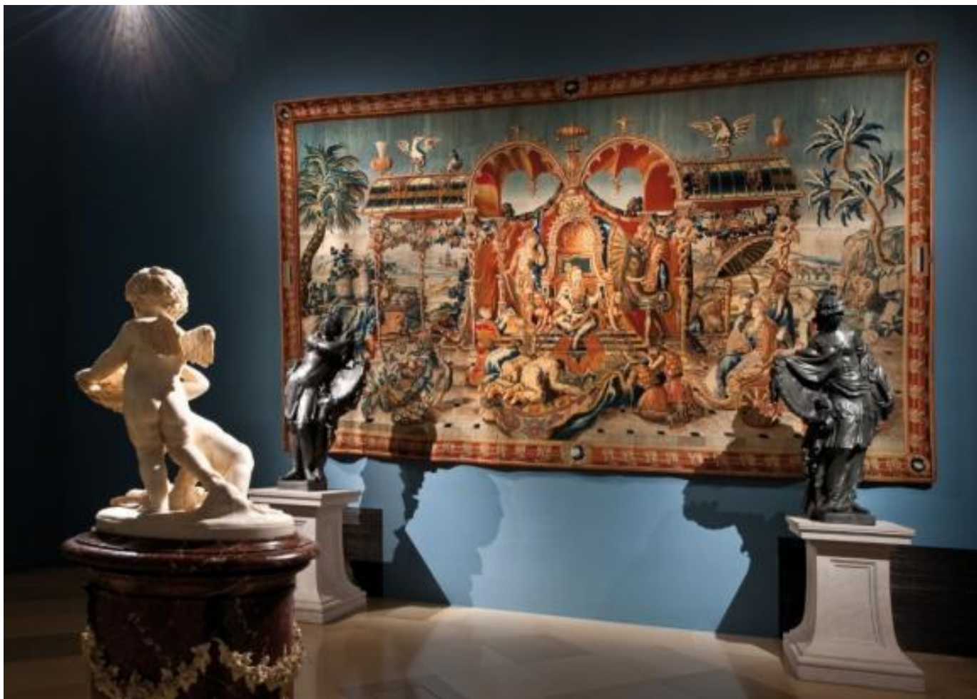
Tapiserie Audience u čínského císaře

Po roce 1948 sloužila část zámku jako pracovní tábor pro ženy. Jízdárna sloužila zemědělským účelům.