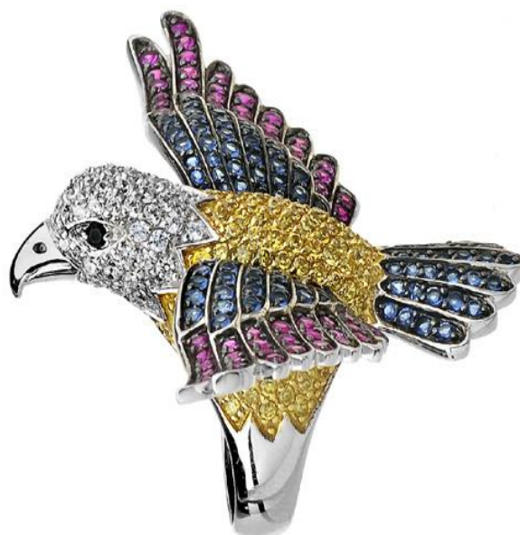
Ukázky z produkce společnosti Swarovski