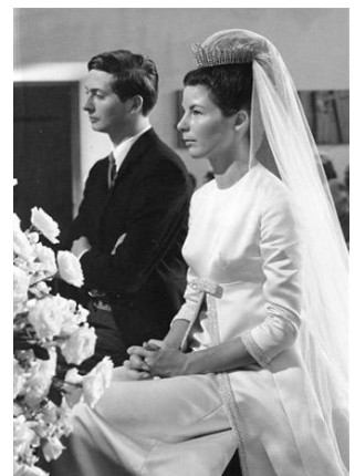
Korunní princ Hans-Adam z Liechtensteinu a Marie Aglaë hraběnka Kinská z Vchynic a Tetova při svatebním obřadu ve Vaduzu.