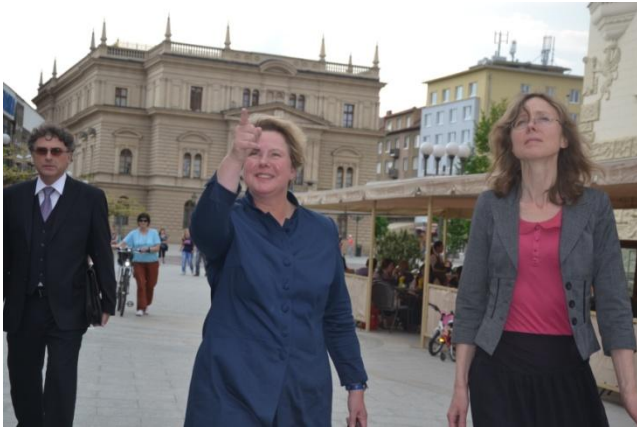
Paní velvyslankyně při prohlídce města Opavy, u kterého obdivovala krásně opravené památky.

Knížectví je proslulé dlouhodobou a cílevědomou podporou školství a vědy, které jsou cílevědomou investicí do budoucnosti země. Lichtenštejnsko nemá surovinové zdroje, musí proto vytvářet know-how a vyrábět produkty nebo poskytovat služby, s vysokou přidanou hodnotou.