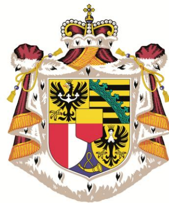
Znaky Opavska, Krnovska a Slezska nalezneme v dolní polovině erbu Liechtensteinů dodnes.

modrém bez jediného šperku. Kalhotový kostým doplňovaly kvalitní hodinky a lodičky téže barvy. A pokud stále nemáte představu, jak taková moderní princezna vypadá, pak vezte, že něco na způsob „nenápadného půvabu aristokracie“.