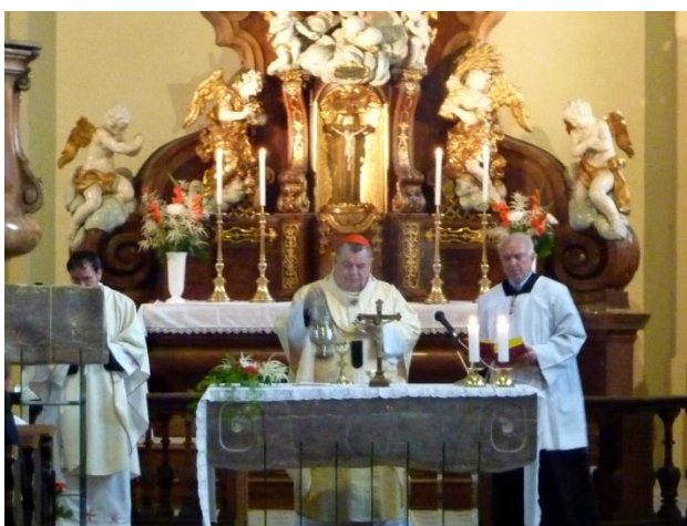
Kardinál Dominik Duka při bohoslužbě v Kostelci nad černými lesy (chrám sv. Andělů strážných).