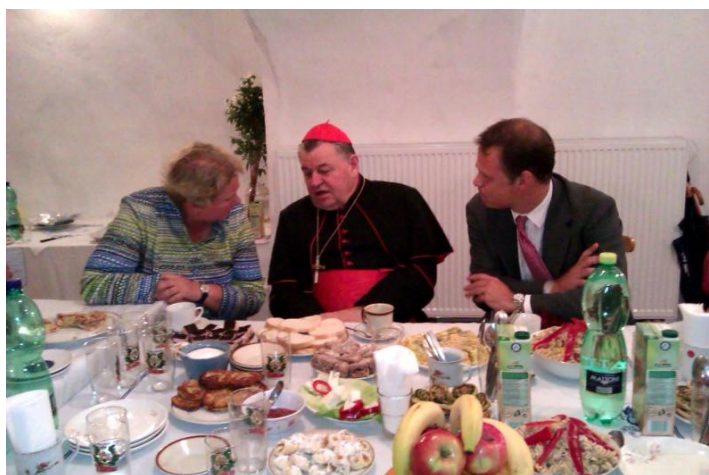
Setkání hostů s panem kardinálem a farníky, po mši svaté na farním úřadě v Kostelci nad černými lesy, bylo velmi přátelské a neformální.