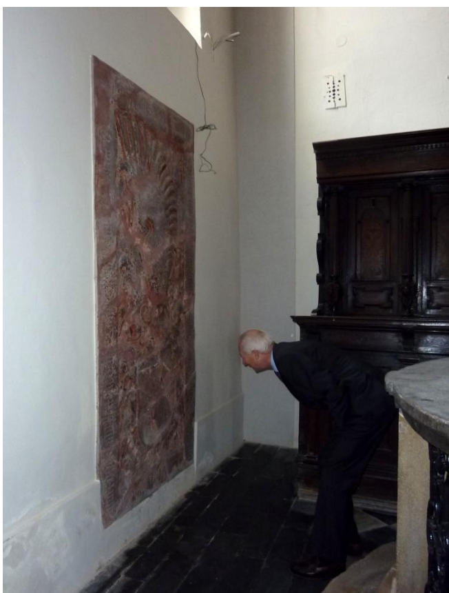
Jeho Jasnost kníže Hans-Adam II. si prohlíží náhrobek Kryštofa z Liechtensteinu v kostele sv. Václava v Mikulově.