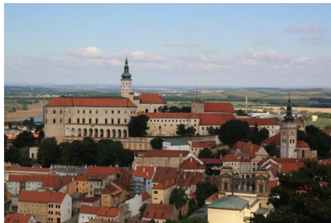
Pohled na Mikulov ze Svatého kopečku, kostel sv. Václava uprostřed vpravo, v popředí – Dietrichsteinská hrobka.

na světě. Jeho země je také známá vysokou kvalitou školství, státní správy a samosprávy a špičkovým průmyslem a službami.