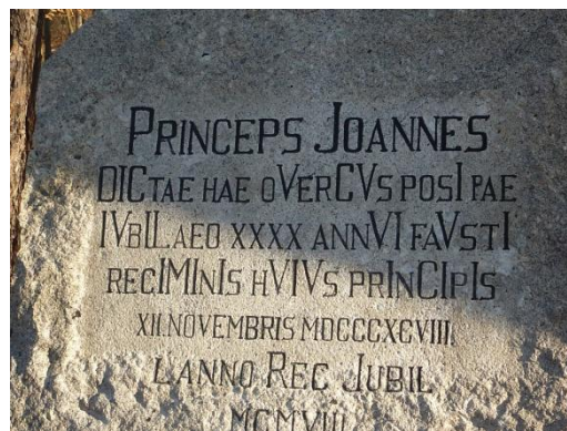
Detail jubilejního kamene v Mukařově (střední Čechy).

V České republice je dochováno asi 160 jubilejních kamenů (např. ve Středočeském kraji jich je 19).