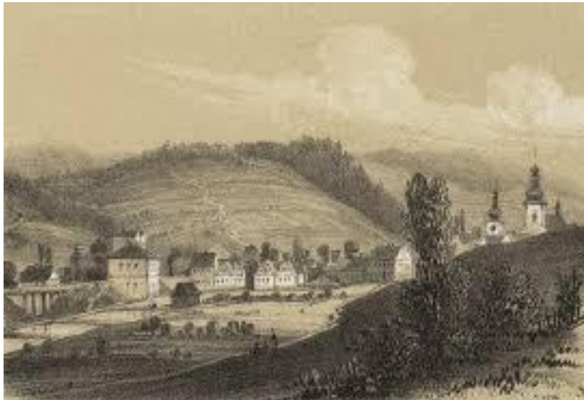
Ústí nad Orlicí, veduta z 19. století