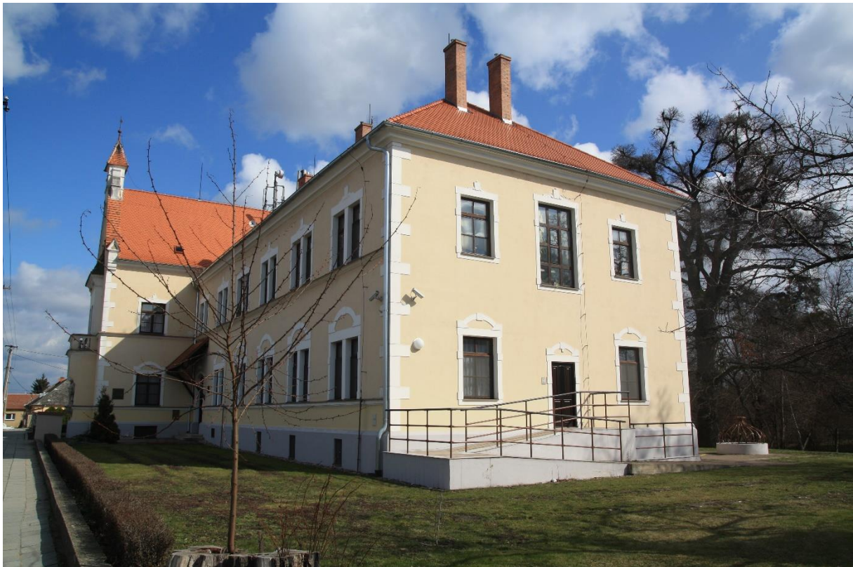
Budova bývalé Vyšší ovocnicko-zahradnické školy v Lednici

Díky zájmu Jana II. o přírodní vědy a jeho velkorysé štedrosti byl v roce 1912 založen prestižní Ústav pro zušlechťování rostlin knížete Jana z Liechtensteinů J. G. Mendela v Lednici (dnes Mendeleum). Kníže opět daroval pozemky na jeho stavbu a školní zahrady, hradil jeho výstavbu a na prvních 10 let garantoval finanční dary na jeho provoz.