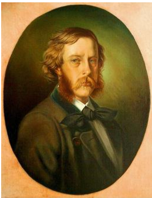
ARCHITEKT LIECHTENSTEINŮ: JOSEF HARDTMUTH