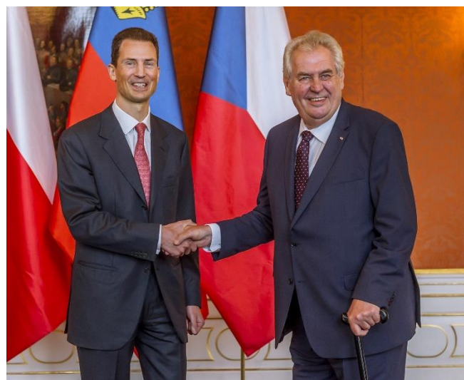
DĚDIČNÝ PRINC ALOIS SE NA PRAŽSKÉM HRADĚ SETKAL S MILOŠEM ZEMANEM PREZIDENTEM ČESKÉ REPUBLIKY

Od obnovení diplomatických styků mezi Českou republikou a Lichtenštejnským knížectvím v září 2009 je to teprve druhé setkání hlav obou států. Prvním byla návštěva vládnoucího knížete Hanse-Adama II. na Pražském hradě 1. června 2010, kdy se setkal s tehdejšími prezidentem České republiky Václavem Klausem, při příležitosti otevření výstavy "Klasicismus a biedermeier z knížecích lichtenštejnských sbírek" , která se konala v jízdárně Valdštejnského paláce v Praze.