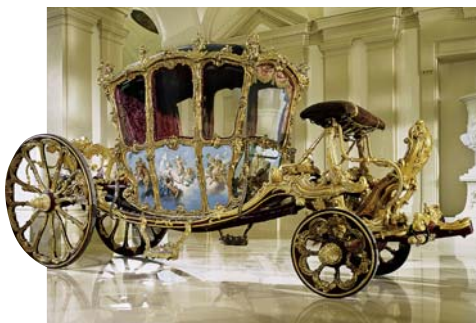
■ Vyslancský kočár knížete Josefa Václava, dnes umístěný v Lichtenštejnském muzeu ve Vídni.

ny tři Brigádní dělostřelecké školy, což dokazuje, že přípravě důstojníků dělostřeleckva byla věnována velká pozornost. Dělostřelecké předměty se později vyučovaly i na proslulé Válečné akademii ve Vídeňském Novém Městě, kterou roku 1750 založila císařovna Marie Terezie.