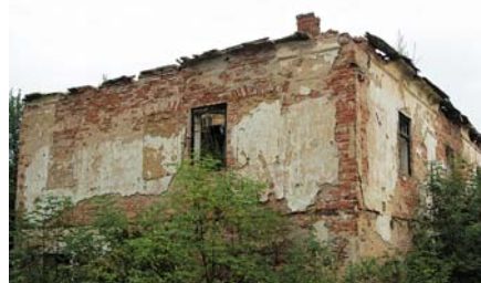
■ Zbytky důstojnické ubytovny ve Velkém depotu u Týna nad Vltavou

Na místě bývalé prachárny stojí nejzajímavější památka na dělostřelecký tábor – sousoší již zmíněné „Kalvárie“. Připomíná