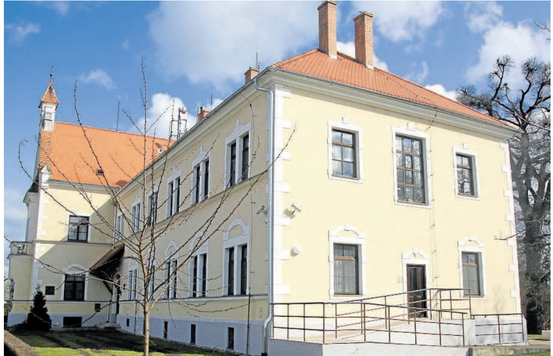
UČENÍ ZAHRADNÍČI. V roce 1895 kníže Jan II. z Liechtensteina založil v Lednici. Vyšší zahradnickou školu. Byla první ve střední Evropě.

Jako vynikající národohospodář Jan II. skvěle řídil svá panství na Moravě, v Čechách a v Rakousku a zasloužil se o zlepšení hospodářské situace